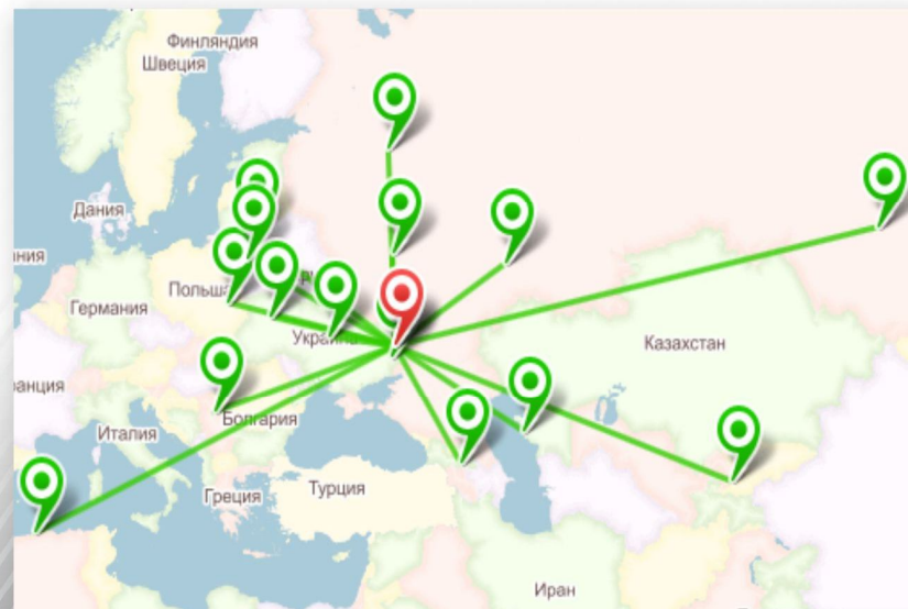
География использования системы