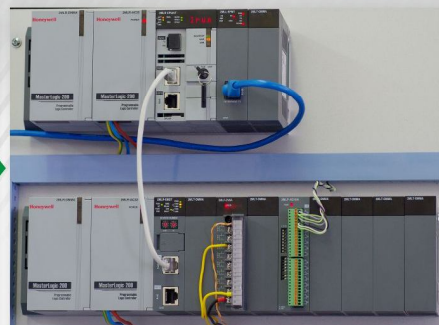
Контроллер Honeywell MasterLogic-200